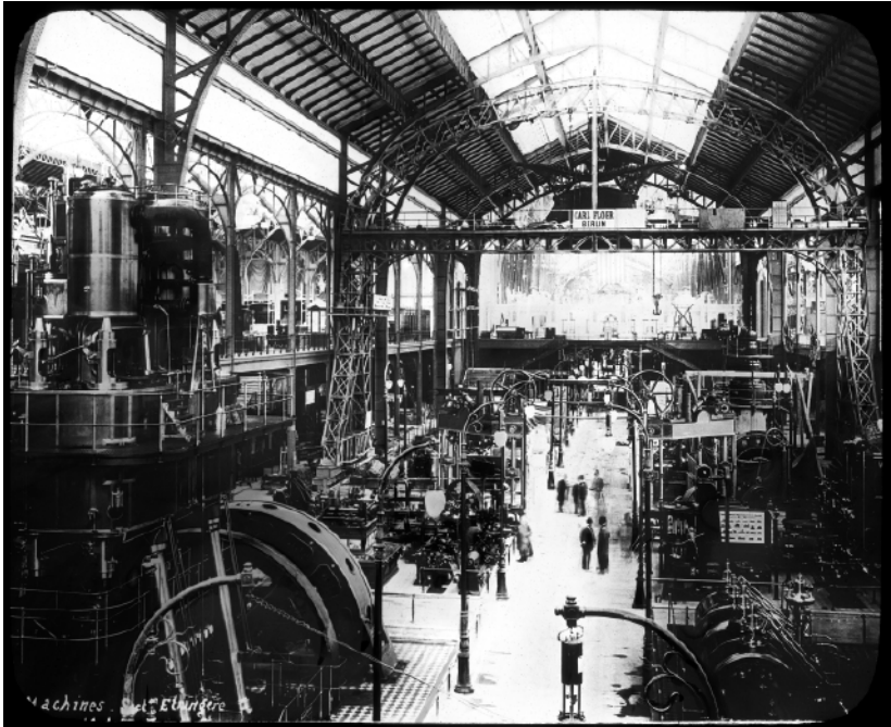
Der Palast der Elektrizität bei der Weltausstellung in Paris, 1900